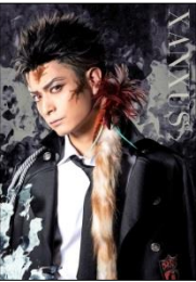
XANXUS(ザンザス): 林田航平