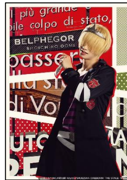
ベルフェゴール： 大海将一郎