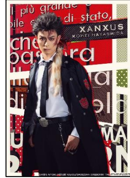
XANXUS (ザンザス)： 林田航平