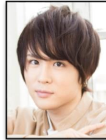
藤堂平助 役:樋口裕太