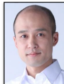
雪村綱道 役:川本裕之