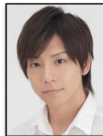
山崎丞 役:椎名鯛造