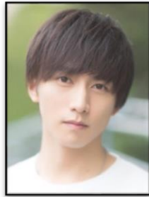
沖田総司 役:山崎晶吾