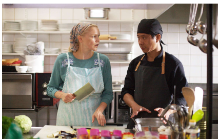
『世界で一番しあわせな食堂』