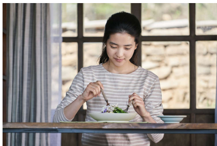
『リトル・フォレスト 春夏秋冬』

© 2018 Daisuke Igarashi / Kodansha All Rights Reserved.