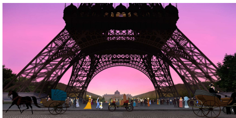
『ディリリとパリの時間旅行』

© 2018 NORD-OUEST FILMS - STUDIO O - ARTE FRANCE CINEMA - MARS FILMS - WILD BUNCH - MAC GUFF LIGNE - ARTEMIS PRODUCTIONS - SENATOR FILM PRODUKTION