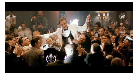
『海の上のピアニスト』