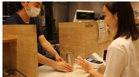
カフェ店舗での容器シェアリングサービスの利用イメージ

環境に配慮した暮らしの重要性や意義について生活者の理解や意識が高まってきている中、飲料用使い捨て容器の削減や飲料代の節約を目的としてマイボトルやマイカップ ※1 を使用する人が増加しています。一方で、そうしたマイボトルやマイカップは環境面や経済面での利点があるものの、持ち運びによる不便さや洗浄の手間を感じることから、継続利用を諦めてしまうことが知られています。そこで、オフィス出勤時にいつでも自由に清潔な容器を借りることができ、持ち運びや洗浄の手間がなく、自分が飲みたい飲料を楽しんでいただける飲料用容器のシェアリングサービスの事業展開を目指し、実証実験を行います。