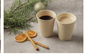
「ウエスティンホテル東京」商品販売例