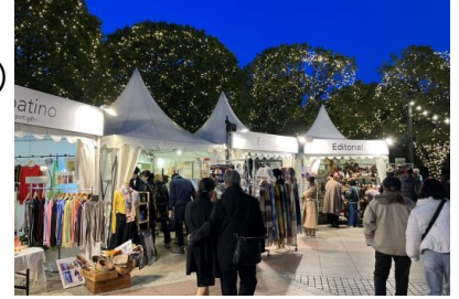
<過去開催時の様子（時計広場）>