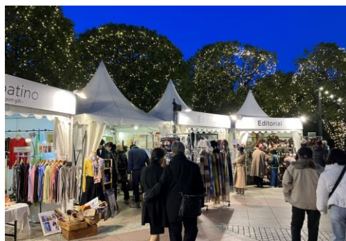
「クリスマスマルシェ（時計広場）」