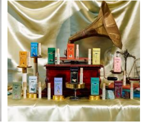
「Editorial」時計広場商品販売例