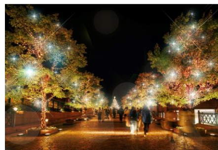
<坂道のプロムナード (イメージ) >