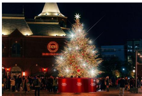
<クリスマスツリー (イメージ) >