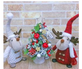
「Editorial」シャトー広場商品販売例