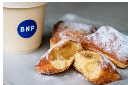
<販売商品例（ベニエ）>