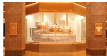
<YEBISU BREWERY TOKYO>

恵比寿ガーデンプレイスではバカラのシャンデリアが輝く美しい季節に、「YEBISU BREWERY TOKYO」でつくられ、ここでしか飲めないフレンチHAZY IPAスタイルのビール「Velvet twilight（ベルベット トワイライト）」を限定発売します。クリスマスにちなんだ限定ビールも発売予定なのでご期待ください。