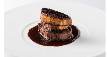
※昨年メニューの一例