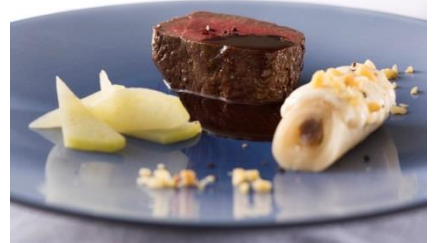
※昨年メニューの一例