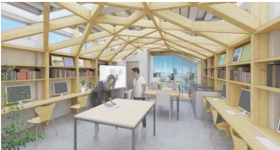
セットアップオフィスイメージ