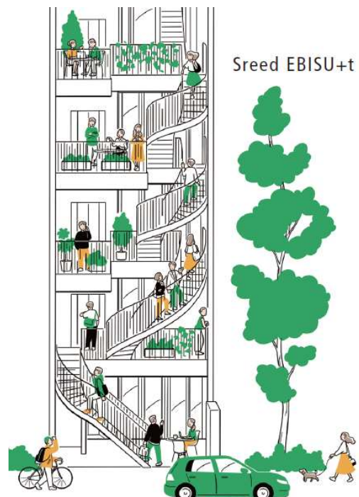
「Sreed EBISU +t」イメージ

「Sreed EBISU +t」公式HP URL : https://www.sapporo-re.jp/business/building_20.php 「Sreed EBISU +t」のプロジェクトの裏側 URL : https://prtmes.jp/story/detail/WBq8G1Smqvb