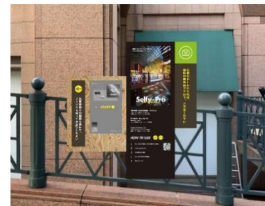
専用端末イメージ画像

スマートフォンやSNSの普及により、いつでも手軽に写真を撮れるようになった昨今、若年層を中心に写真をシェアする機会が増え、その時その場所での思い出を記録に残したいというニーズが高まっています。当社が運営する「恵比寿ガーデンプレイス」は、恵比寿のまちのランドマークであるとともに、ヨーロッパの街並みをイメージした象徴的な建築物や風景美を有しており、竣工からまもなく28年を迎える今なお、年間を通じて多くの皆様に訪れていただいています。そうしたニーズと「恵比寿ガーデンプレイス」を象徴する風景を掛け合わせ、フォトスポットの有料サービス「セルフイープロ with フォトビーズ！」展開に向けた実証実験を恵比寿ガーデンプレイスのセンター広場で実施します。