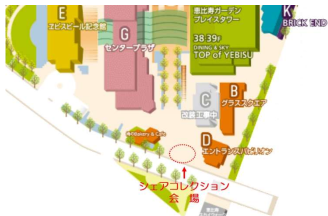
恵比寿ガーデンプレイス MAP