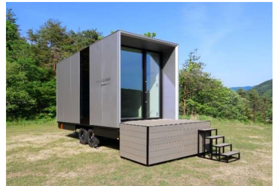
トレーラーハウス「mobileCLASCO」(イメージ)