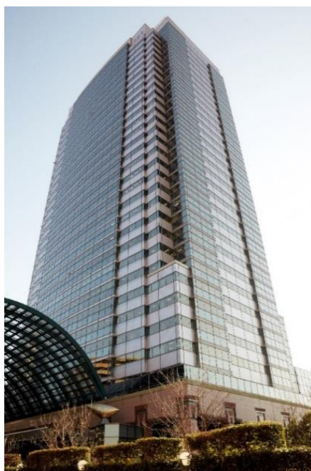
恵比寿ガーデンプレイスタワー

当物件は、恵比寿のランドマークとして、1994年8月に竣工しました。以来30年近くにわたり、継続的なバリューアップおよび運営管理などの工夫によって高い健康・快適性を実現したことで、最高位Sランクの獲得に至りました。Sランクの認証は、2023年7月現在、築20年以上の都内賃貸オフィス物件では初の事例です。