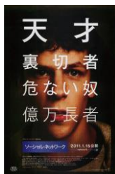
『ソーシャル・ネットワーク』