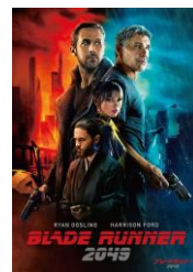
『ブレードランナー 2049』