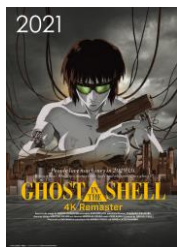
『GHOST IN THE SHELL 攻殻機動隊 4Kリマスター版』

©1995 士郎正宗 / 講談社・バンダイビジュアル・MANGA ENTERTAINMENT