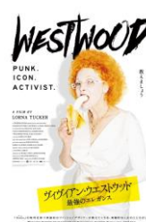
『ヴィヴィアン・ウエストウッド 最強のエlegance』

©1995 士郎正宗 / 講談社・バンダイビジュアル・MANGA ENTERTAINMENT