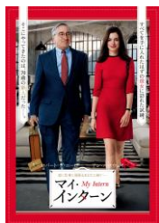
『マイ・インターン』