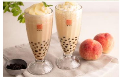
(左) タピオカ白桃鉄観音ミルクティー (右) タピオカ白桃ミルクティー