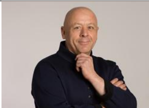
<ティエリー・マルクス氏>

フレンチの基本を大切にしながらも、先進的料理技法による新しい美食を迫及している料理人です。ブーランジェリー(パン職人)としてパンの製造も得意としています。2006年に有名なレストランガイド「ゴー・エ・ミヨ」で今年のシェフにも選ばれ、「星の請負人」の異名を持っています。ストリートフード協会を率い、食を通じて積極的に社会貢献活動を展開しています。大の親日家でもあり武道の精神を大切に柔道、剣道、合気道も修めています。