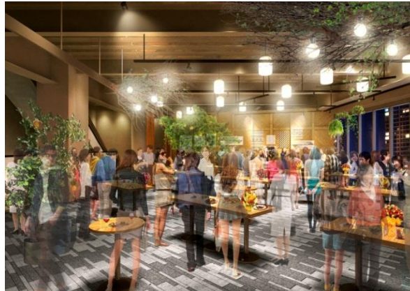
<「GINZA PLACE CAFE（仮称）」イメージ>

施設3階にオープンするイベントスペース&カフェ「GINZA PLACE CAFE（銀座プレイスカフェ）（仮称）」は、「発信と交流の拠点」を象徴する場として、様々な形でご利用いただけるイベントスペースとして発信を行ってまいります。イベントを実施しない通常時は、上質な空間とお食事やドリンクをお楽しみいただけるカフェとして営業いたします。イベント利用に関するお問い合わせは本日6月15日より受け付けを開始します。詳細は「GINZA PLACE」公式サイト ( http://ginzaplace.jp/ ) をご覧ください。