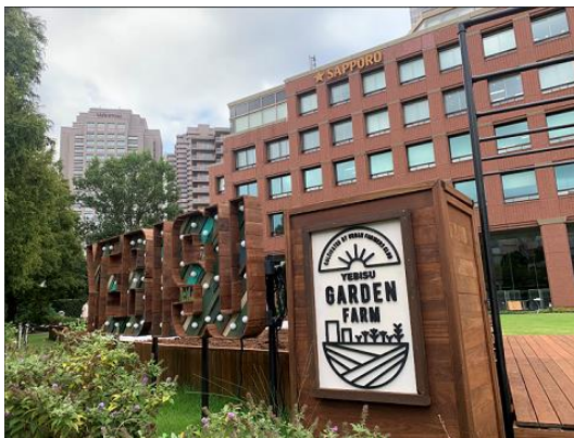
「YEBISU GARDEN FARM」

サッポロ不動産開発株式会社（本社：東京都渋谷区、代表取締役社長：時松 浩）は、2月発表の成長戦略（※1）で掲げた恵比寿でのまちづくりの推進施策として、運営する複合商業施設「恵比寿ガーデンプレイス」内に、まちの中の畑の学校「YEBISU GARDEN FARM ACADEMIA」の開校及び、コミュニケーションスペース「YEBISU GARDEN BASE」を開設致します。