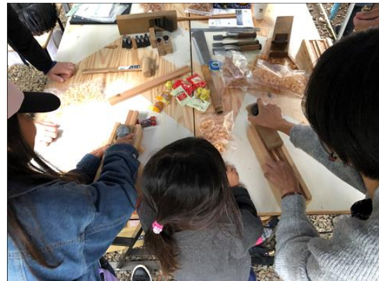
「YEBISU GARDEN BASE」ワークショップイメージ

当社は、サッポログループが1889年（明治20年）にビール醸造所を建設し、約100年にわたりエビスビールを造り続けてきた恵比寿のまちの更なる活性化にむけ、地域の方々、来街者やオフィスワーカーの皆様と共に、まちづくりの機運を醸成し、より魅力的なまちに育てていくことを目指した取り組みを行っています。2020年8月に始動した“まちと共に育てる”都会のコミュニティファーム「YEBISU GARDEN FARM」、地域SNS「ピアッツァ」等に続く施策として、恵比寿ガーデンプレイスを起点とした2つの取り組みを実施します。