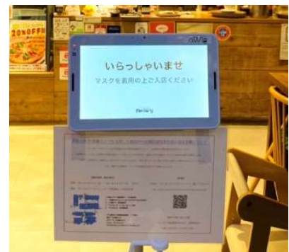
「AWL Lite」10 インチタブレット店舗設置イメージ

本実証実験では、AWL 株式会社の AI カメラソリューション「AWL Lite」をサッポロファクトリーに導入して実施します。施設内飲食店入口に AI 搭載カメラ「AWL Lite」10 インチタブレットを設置して店舗の混雑状況を取得し、サッポロファクトリー内の通路に設置したデジタルサイネージ上に表示します。また、デジタルサイネージに設置した AI 搭載カメラ「AWL Lite」STB 型端末を用いてデジタルサイネージの視聴者分析を行い、視聴者に対して視聴者の属性に合わせた最適な各店舗のおすすめメニューを表示し、飲食店舗への自発的な回遊行動を促します。