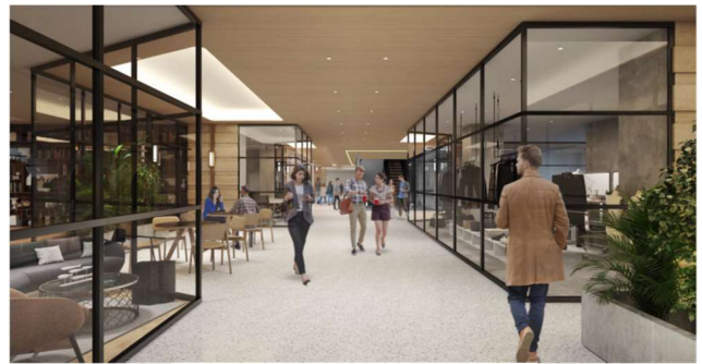
地下1階フロアイメージ