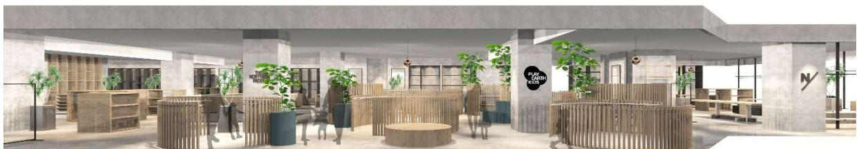
「プレイヤーズキッズ」イメージ

業界最大級のホームセンター「DCM」が初めて展開する、“DIYによる暮らし快適化”を掲げた「DCM DIY place (ディーシーエム ディーアイワイ プレイス)」は、日々の暮らしを快適にするツールとアイデアを店内で表現し、「やってみたら、自分でできた！」を応援する体験型の新業態です。また、スポーツアパレルメーカーのゴールドウインは、関東最大の売場面積で3ブランドを出店。中でも、ゴールドウインが展開するキッズアイテムを横断的に扱うキッズ・エディトリアルショップ「プレイヤーズキッズ」は、同社の「PLAY EARTH」というコンセプトのもと、遊びと自然を通して子どもの未来をつくるためのプロジェクトから生まれた、新業態です。その他、アウトドアショップやスペシャリティコーヒーショップなどを迎えます。