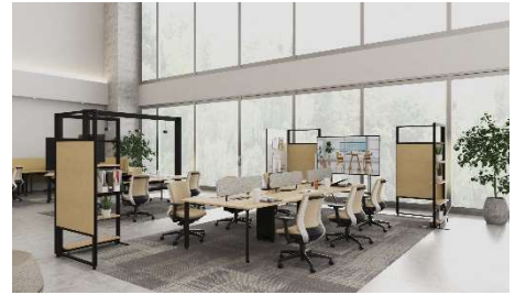
2階 オフィスイメージ

室内とシームレスに繋がった広いテラスを併設する2階のフロアは、都会にいながら自然を感じられる開かれた空間で、心地よく仕事と向き合えるワークプレイスにリニューアルします。本フロアには、オフィス家具の製造・販売を展開するプラス株式会社、オフィステナントとして入居します(2022年11月下旬オープン)。なお、同社は、1階にワーク&ライフスタイルショップ「おうちガラージ」、また、地下1階には、居心地よく、最適な働きかたの提案を行うワークスタイルショップ&ショールーム「クリアトレーウィズプラス」(東日本初)も展開します。 (店舗詳細は出店店舗一覧をご覧ください。)