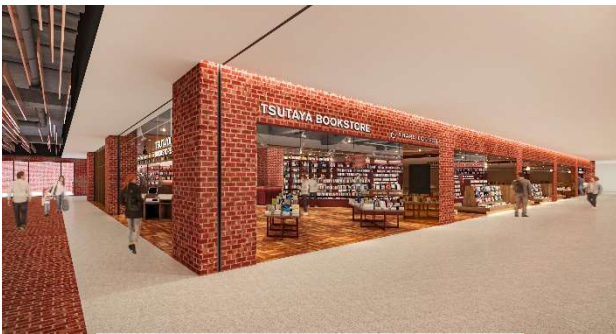
「ツタヤブックストア」イメージ

「インスパイアされる空間で『自分らしいすごしかた』が見つかる場所」をコンセプトとして、シェアオフィスとラウンジ両面の機能を備えもつ「SHARE LOUNGE」を併設する「ツタヤブックストア」が恵比寿エリアへ初出店するほか、周辺ワーカーからご要望の多かった出勤・始業前の“充実した朝時間”をお過ごしいただける早朝営業のカフェを拡充しました。隣接するオフィスエリアでは、新しい働きかたを実現する豊かな価値と発信機能を提供する、まちと繋がるガラス張りのショールーミングオフィスを展開します。