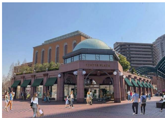
センタープラザ エントランスイメージ

URL: https://gardenplace.jp/special/meet_new_yebisu/