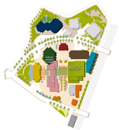
恵比寿ガーデンプレイス MAP