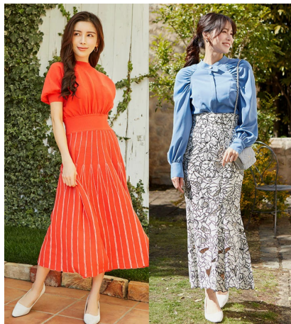
ファッションレンタルのRcawaii

Rcawaii（アールカワイイ）は、お洋服がレンタルし放題、スタイリスト付きの新感覚ファッションサービスです。レンタル開始方法も簡単で、好みの色などいくつかの情報を登録したら、プロのスタイリストがスタイリングしてくれた初回コーデの到着を待つだけ！とっても簡単かつリーズナブルに、「自分に一番似合うカワイイ」お洋服をレンタルして、気に入った洋服だけそのまま購入することもできます。