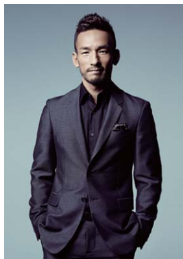
中田 英寿氏 元サッカー日本代表