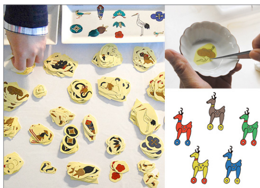
※限定シール「鹿のおもちゃ」イメージ(写真右下)