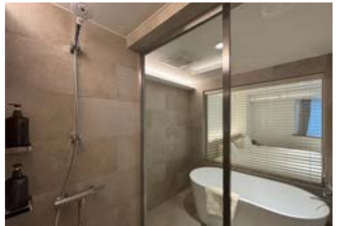
『グランデスイート』のゆったりとしたバスタブ