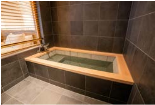
檜の香りと窓の外に揺れる樹々に癒される