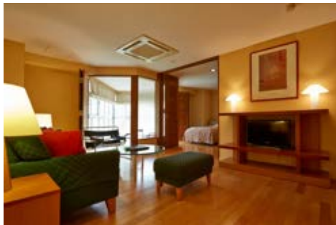
ホテルス波尔シオン デラックスルーム