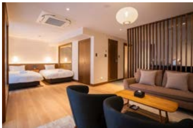
落ち着いた雰囲気『グランデスイート』

グランデスイート限定： コネクティング利用で最大10名様まで宿泊でき、3世代旅行やグループ利用にもおすすめです。