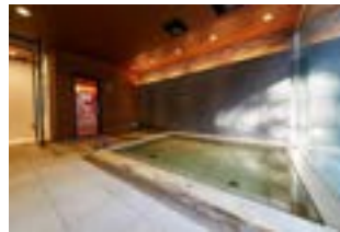
FOREST SPA 男性浴場