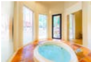
FOREST VILLAG 客室バス

FOREST SPAには男女それぞれにドライサウナとミストサウナがあり外気浴も楽しめる。