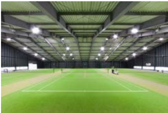
インドアテニスコート