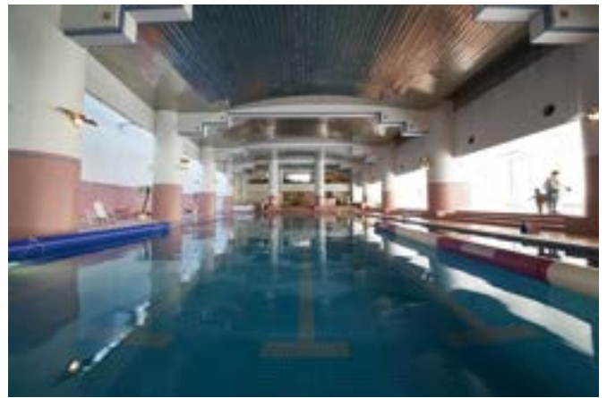
夏季シーズンには日焼けも気にせず楽しめるインドアプールが人気

ゆとりのある客室、充実したスポーツアクティビティで、心身を浄化し、富士山のパワーをチャージする贅沢なひとときをお過ごしいただけます。