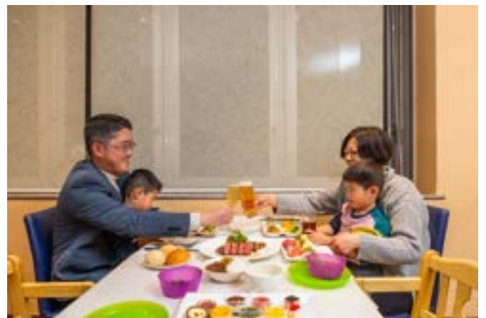
お子様用の椅子やカトラリーもご用意しております。