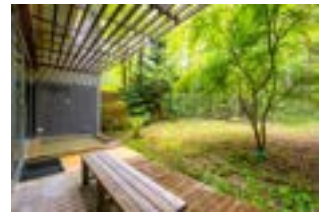
外気浴を楽しんで

2、清々しい空気と森林浴：富士山麓の原生林に囲まれ、標高が高いため、清々しい空気の中での森林浴効果により、上質な睡眠と深いリラクセスが得られます。