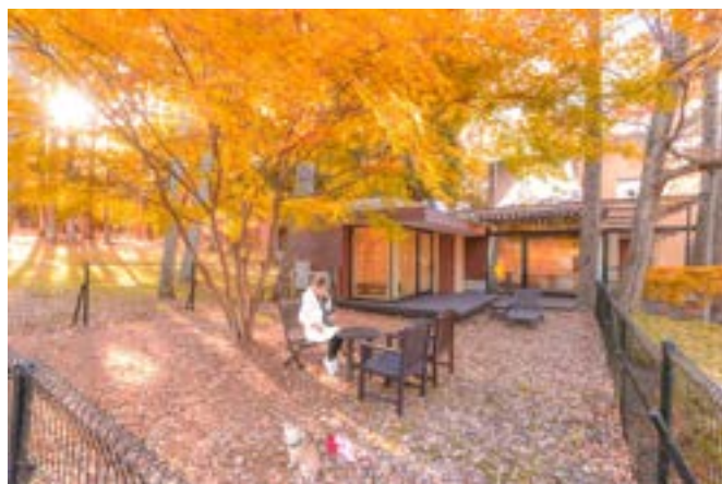
紅葉の時期のプライベートガーデンのある客室