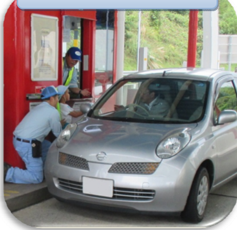
料金所模擬施設での料金収受