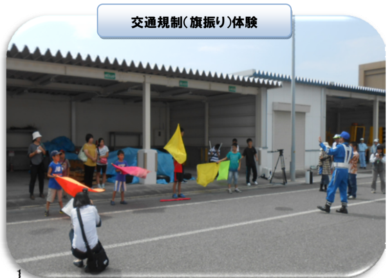
交通規制(旗振り)体験