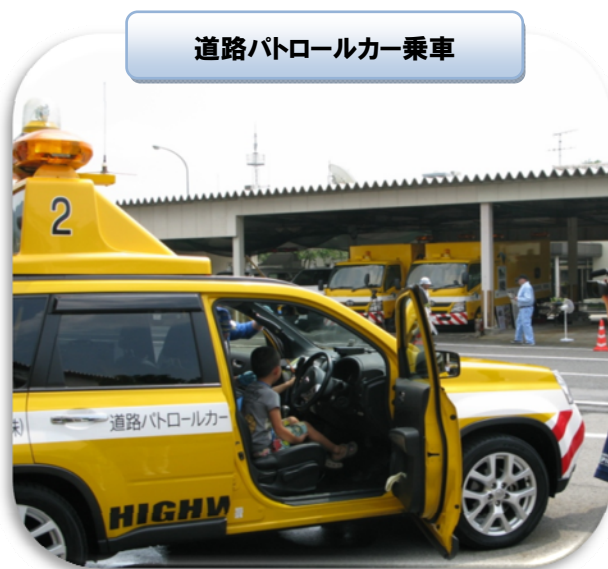
道路パトロールカー乗車