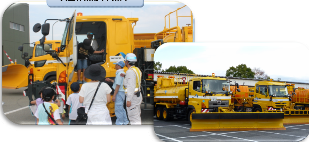
大型作業車両乗車