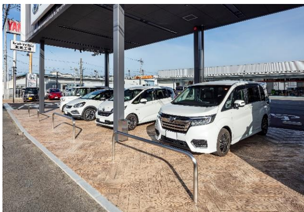
ベースカラー/DC-2310 リリースパウダー/アースブラウン