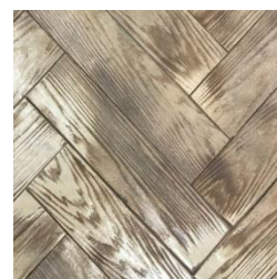
ベースカラー/DC-2310 リリースパウダー/セピア