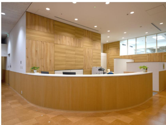
写真はアーバンラウンダーです