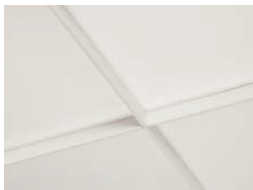
ホワイト×ホワイト