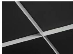
ブラック×ホワイト