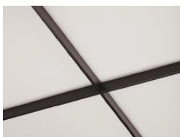
ホワイト×ブラック