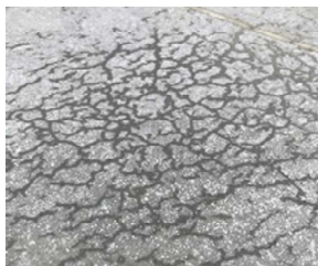
プラスチックひび割れ