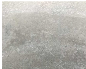
プラスチックひび割れを低減