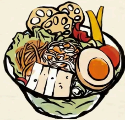
〈めんたい彩りサラダ〉 パプリカに変更