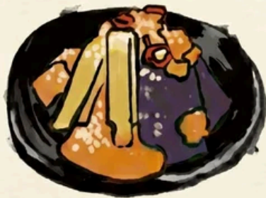
〈めんたい漬け〉 茄子に変更