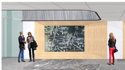
金属製の京都市内マップ

エントランスを入るとまず金属製の京都の大型マップが目飛び込んできます。その右手の壁一面には、100種類を超える四条烏丸周辺のディープでユニークなトピックを紹介するホテルオリジナルの京都ガイドカード「Exploration（探検）カード」が並びます。ゲストは旅のテーマに合わせて自由にカードを集め、自分だけのガイドブックを作ることができます。また、EN LOBBYの奥には、茶釜からお湯を柄杓で汲んで、ホテルセレクトの日本茶を楽しむスペースを完備しています。