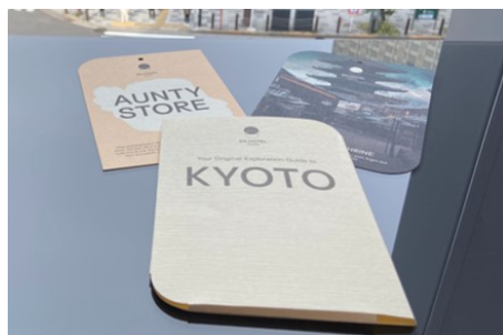
京都ガイドカード「Exploration カード」