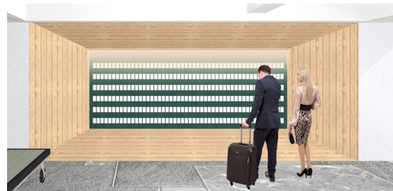
「Exploration（探検）カード」ボード