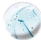
加水分解コラーゲン

保湿成分として「加水分解コラーゲン」や、オーガニック認証植物エキス(セージ葉エキス/ラベンダー花エキス/ローズマリー葉エキス)を、贅沢に配合しています。