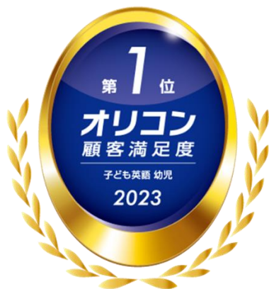
2023年 オリコン顧客満足度®調査 子ども英語 幼児第1位

* 調査結果詳細 https://juken.oricon.co.jp/rank-kids-english/preschooler/company/eccjr/