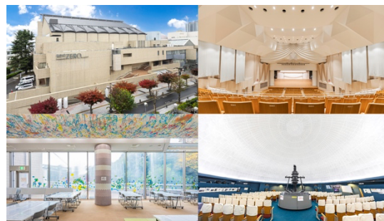
2026 年 4 月～ 指定管理者として中野区文化施設の運営を開始