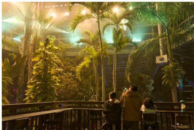
熱帯植物館ライトアップショー