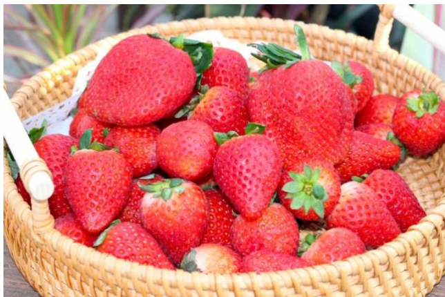
ブランド苺食べ比べバスケット(1 名様分)

※2 2025 年 12 月 18 日発表の『第 20 回ニフティ温泉 年間ランキング 2025』にて、ニューオープン部門東日本第 1 位を受賞。