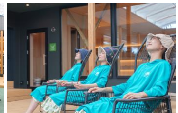
ととのいスペース