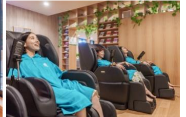
マッサージチェアブース