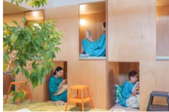
おこもりスペース