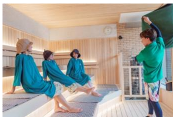
アウフグースイメージ

男女共用のサウナを有した中庭空間です。館内着で楽しめる大型サウナ室にはフィンランド HARVIA 社製のサウナストーブを設置。毎日、熱波パフォーマンスやアウフグースを開催します。また、ガーデンの中央にはトランポリンのように飛び跳ねる「ふわふわドーム」を用意し、お子さんが楽しんでいる姿を、サウナから見守ることができます。