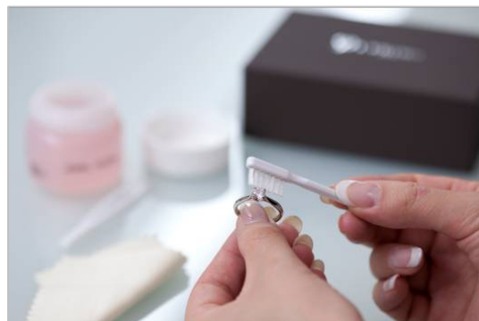
充実のアフターケアで大切な指輪を末永く身に着けられま