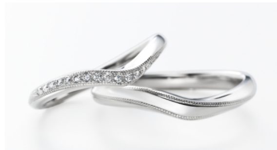
マリッジリング『レーシア』写真左:女性用 右:男性用

商品名: レーシア (Lacier) 価格: 132,000 円(女性用) 123,000 円(男性用) 材質: プラチナ 900、ダイヤモンド