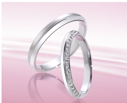
写真 上:『レーシア』 下:『パーティクル』

今回発表するマリッジリング2型のデザインテーマは、“スイート&スマート”。近年ファッションジュエリーを楽しむ男性が増え、個性を尊重するデザインが求められる傾向にあり、「男性は格好良く、女性は可愛らしく」をコンセプトにデザインされました。『レーシア』『パーティクル』共に、女性用はダイヤモンドが連なった可愛らしく、華やかな印象に。男性用は女性用の形状を活かしながら、それぞれにデザインアクセントを施した、クールな中にもスタイリッシュな印象を重視しています。