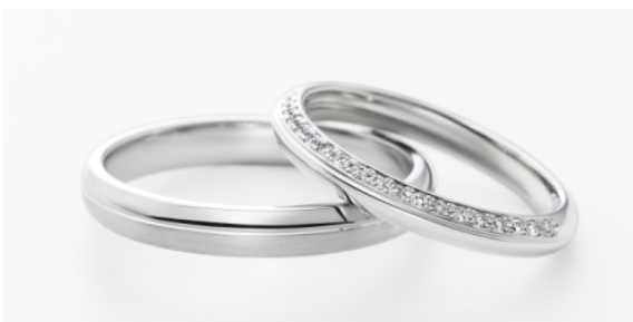
マリッジリング『パーティクル』写真左:男性用 右:女性用

商品名: パーティクル (Particle) 価格: 152,000 円(女性用) 133,000 円(男性用) 材質: プラチナ 900、ダイヤモンド