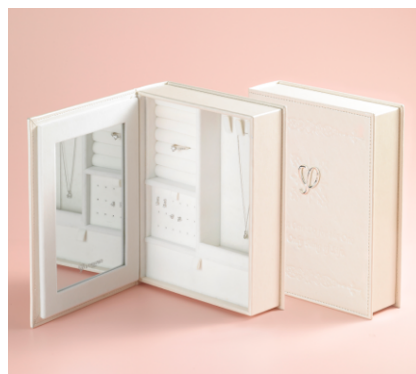
＜サイズ＞縦 21cm×横 16.5cm×奥行 5.2cm

洋書風にデザインされた縦型のジュエリーボックス ホワイトクリスマスをテーマカラーに採用し、表紙の裏面には大きめのミラーを付けました。 指輪はもちろんネックレスやピアスも整理して収納できる優れものです。