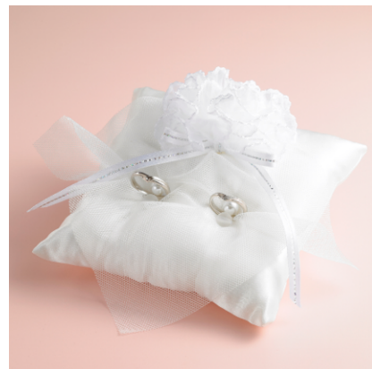
＜サイズ＞縦 12.5cm×横 12.5cm

花嫁様のウェディングシーンをテーマに、 ブーケとベールをあしらったデザインです。 リングを立体的にセッティングできるため、 指輪交換のセレモニーで指輪が掴みやすい ものを採用しています。