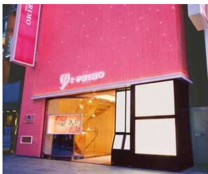
アイプリモ銀座本店外観