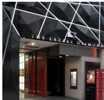
ラザールダイヤモンドブティック銀座本店外観