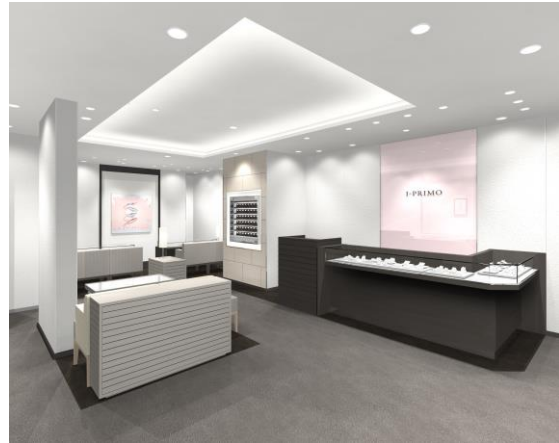
■アイプリモ川越店 内観イメージ

アイプリモは、新しいデザインコンセプト「Fortune Diamond」を体感出来る店舗をオープン致します。