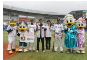
2012年7月7日(土) 千葉ロッテマリーンズ