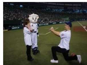
2012年5月25日(金) 埼玉西武ライオンズ