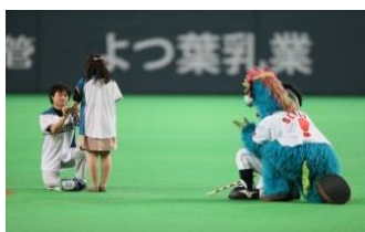
2012年6月5日(火) 北海道日本ハムファイターズ