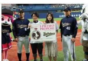
2012年6月17日(日) オリックス・バファローズ