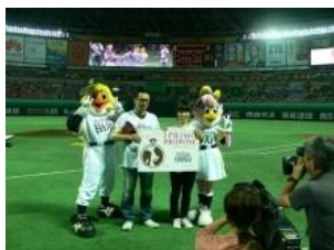
2012年5月22日(火) 福岡ソフトバンクホークス