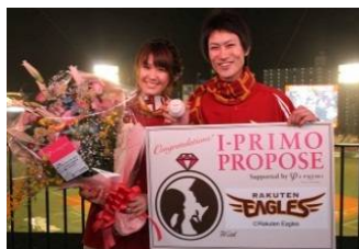
2012年4月25日(水) 東北楽天ゴールデンイーグルス

パ・リーグ 6 球団の各球場で、サプライズあり涙ありの感動のプロポーズが生まれました！