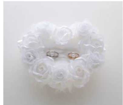
サイズ:幅:15cm/奥行:13cm/高さ:6cm

デザインコンセプトは「天使のピロー」。 バラの花モチーフをベースにハート型にセッティング。ファーが可愛らしさと華やかさを演出。 マリッジリングをパール留めで挟み込む仕様として います。