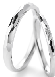
マリッジリング『テセラ』写真左:男性用 右:女性用