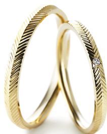
マリッジリング『レアーリ』写真左:男性用 右:女性用