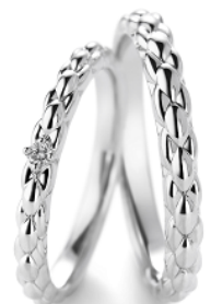
マリッジリング『トレキア』写真左:女性用 右:男性用