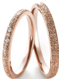
マリッジリング『エレナ』写真左:女性用 右:男性用

お客様からのお問い合わせ先:アイプリモ銀座本店 Tel.03-3569-3560(営業時間 11:30~19:30)