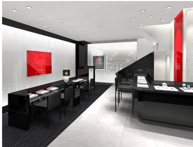
■ ラザールダイヤモンド大宮本店内装イメージ

優れたカット技術と品質の高さによる類まれなダイヤモンドの輝きと、ニューヨークブランドならではの洗練されたデザインで100年以上世界中で愛され続けている、ラザールダイヤモンド。この度オープンする大宮本店を含め、ラザールダイヤモンドブティックは全国12店舗、首都圏では銀座本店に続く2店舗目となります。それにより、生活圏に密着したエリアでブライダルリングをお選びいただけます。また、ラザールダイヤモンドの既存他店で購入されたお客様については、商品のアフターケアやクリーニング等で大宮本店をご利用いただけます。店舗ではダイヤモンドの輝きを最大限に引き出す照明設計にこだわり、太陽光に近い白色の光が特徴のLED照明をすべてのブースに設置いたします。