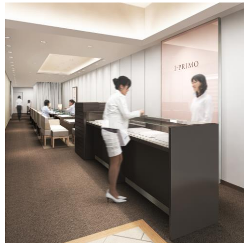
■アイプリモ松山店 内観イメージ

アイプリモ松山店は、新しいデザインコンセプト「Fortune Diamond」を体感出来る店舗として、外装や店内設備などを大幅にリニューアル致します。