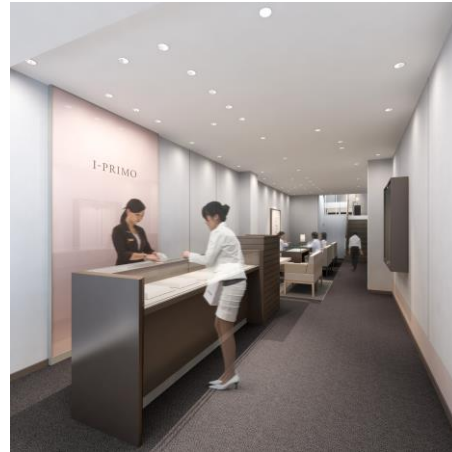
■アイプリモ高知店 内観イメージ

今回移転オープンするアイプリモ高知店は、旧店舗と同じ高知市中心街の「よさこいタウン」内に位置し、新たに大型百貨店と隣接することから、より多くのお客様にご来店いただくことを目指しております。