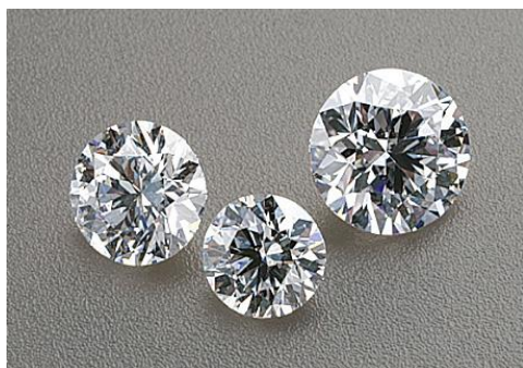
ダイヤモンドの仕入れとすべてのクオリティに自信

日本最大規模の店舗数を誇るブライダルジュエリー専門店「アイプリモ」。 豊富なダイヤモンドルース(裸石)とリングの中から好みのものを選んで婚約指輪をつくる『セレクトオーダー』を主な販売方法とし、日本全国に 65 店舗・台湾 10 店舗・香港 3 店舗(2016 年 5 月 30 日現在)を展開しております。ピンクのブランドカラーは、幸せいっぱいのおふたりの“幸福感”を象徴し、専門店ならではの多彩なデザインバリエーションにより、好みの婚約指輪・結婚指輪をお選び頂けます。末永く輝き続ける指輪をサポートするためアフターケアも充実させ、総合的な魅力でブライダルカップルより、多くの支持を得ております。