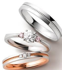
運命のリングが見つかる豊富なバリエーションをご用意