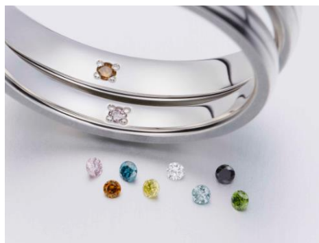
オリジナルサービス「8色のプロミスダイヤモンド」