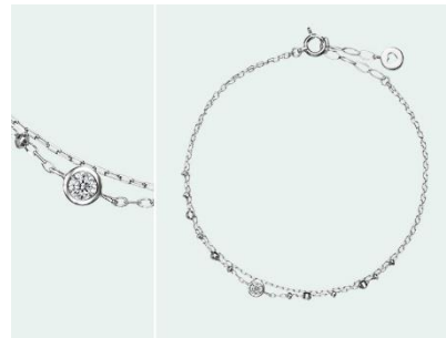
Viala (ヴィアーラ) K18WG 38,000円 (税込)