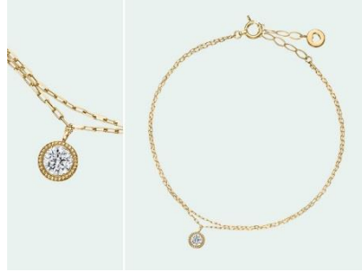
Millenare (ミルナーレ) K18YG 35,000円 (税込)