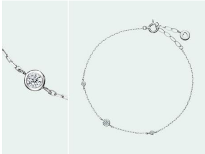
Picore Circle (ピコレ サークル) K18WG 41,000円 (税込)

ブレスレットのコンセプトはギフトジュエリー。アイプリモで初めて取り扱うアイテムです。華奢で繊細な作りになっており、装着して動くたびにダイヤモンドが揺れて輝きが美しく、ギフトとして喜ばれるようにトレンド感を意識して仕上げたシンプルでコーディネートしやすいブレスレットです。