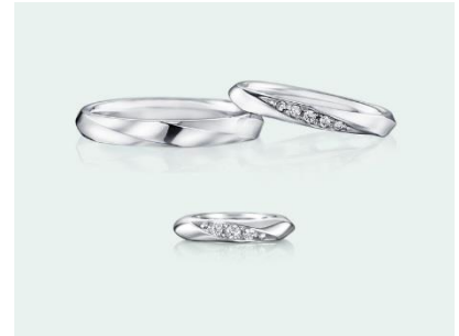
下：Fortuna Baby（フォルトゥーナベビー） K18WG 32,000円（税込）