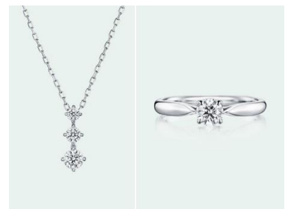
左：Ceres（セレス）ネックレス Pt950 168,000円（税込）