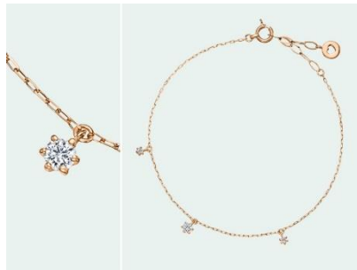
Picore Swing (ピコレ スウィング) K18PG 41,000円 (税込)