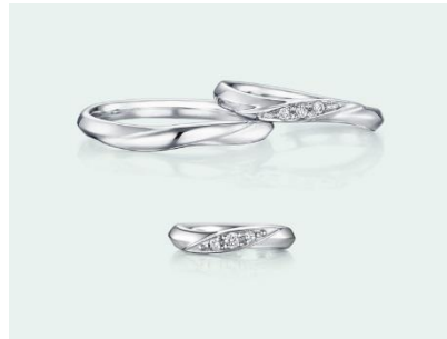
下：Lucina Baby（ルキナベビー） K18WG 32,000円（税込）