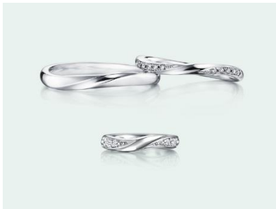
下：Perseus Baby（ペルセウスベビー） K18WG 32,000円（税込）

ベビーリングのコンセプトは、メモリアルジュエリー。アイプリモではこれまで婚約指輪とお揃いのベビーリングをご用意しておりましたが、今回初めて結婚指輪とお揃いのベビーリングをご用意いたしました。デザインは結婚指輪の人気デザイン3型。お子様へのファーストジュエリーとして記念に両親とお揃いのリングをお選びいただくことができます。