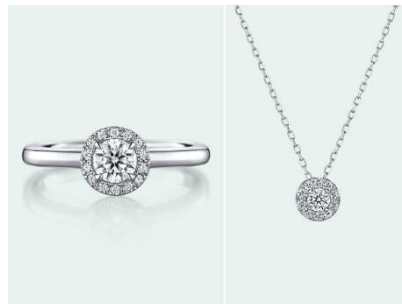
右：Fomalhaut（フォーマルハウト） ネックレスPt950 168,000円（税込）