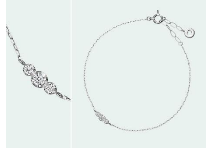
Picore Nebula (ピコレ ネビュラ) K18WG 35,000円 (税込)