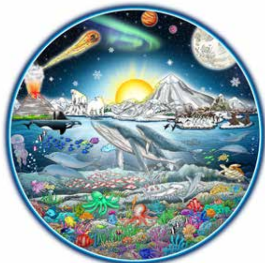
「ディスカバー・アワー・ワールド」 額サイズ 約53x53cm 税込396,000円