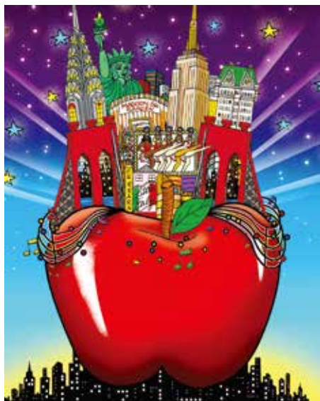
「サウンド・オブ・リトルアップル」 額サイズ 約35x31cm 税込165,000円