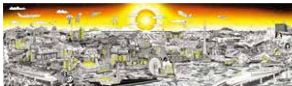
「トラベリング・ジャパン (Color, Mixed)」 額サイズ 約43cmx83cm 税込各418,000円