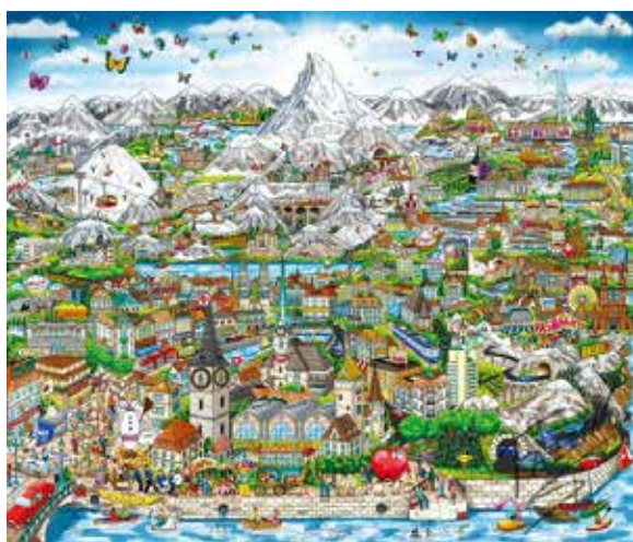
「サイト&サウンド・オブ・スイス」 額サイズ 約86x96cm 税込1,430,000円