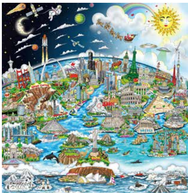
「ワールド・フォー・アス」 額サイズ 約83x79cm 税込1,045,000円