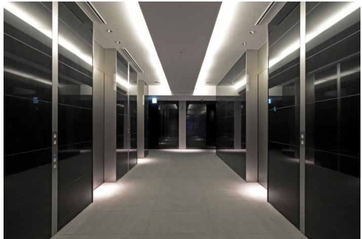
<名古屋プライムセントラルタワー>