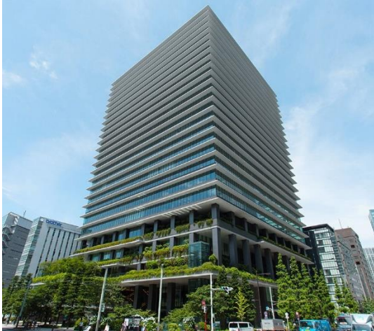
<東京スクエアガーデン>