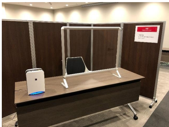
【ワクチン接種ブース】