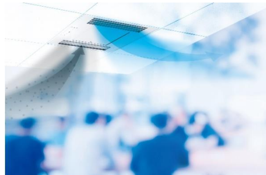
除菌・消臭イメージ

エアロピュア シリーズ C は、深紫外線 LED と光触媒フィルターを組み合わせた除菌※1 と消臭に特化した技術を用いて、約 30 畳（目安）の空間をクリーンに保ちます。光触媒フィルターが、装置内に取り込んだ空気中のおいやアレル物質を捕捉し、分解。さらに装置内を通過する空気に対して深紫外線を照射することで除菌を行い、クリーンになった空気を放出します。この動作を繰り返すことで、室内の空気を清浄化します。