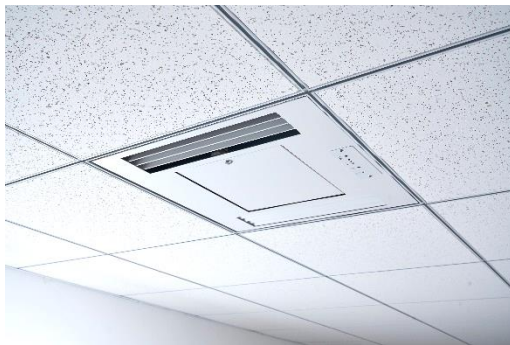
実際に設置された様子

日機装株式会社（本社：東京都渋谷区、以下「日機装」）は、システム天井パネルを外し、天井裏から天吊りするだけで設置ができる空間除菌消臭装置 Aeropure® (エアロピュア) series C を 2022 年 6 月 27 日 (月) から発売します。