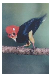
キモマイコドリ ～機敏なムーンウォーク～