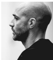
ラッセル・マリファント

世界的コレオグラファーであるRussel (ラッセル) 氏が監修した、様々な動物たちの求愛表現を人間がダンスで表現したPVを公開。