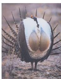
キジオライチョウ ～ボインに毛皮～