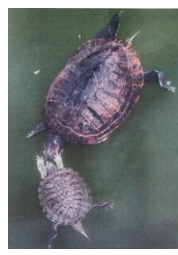
ミシシippアカミミガメ ～華麗なる爪先テクニック～