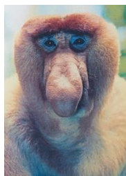
テングザル ～鼻の大きさが男の度量～