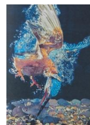
カワセミ ～甲斐性のある男～