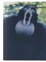
フクロテナガザル ～ロングデュエット～