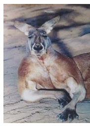
アカカンガル ～内気な男～