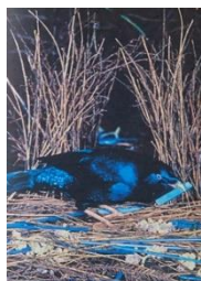
アオアズマヤドリ ～彼女の好きな色は青～