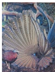
セイラン ～隙間から覗き見～