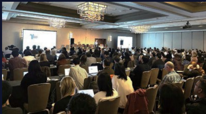
サンフランシスコベイエリアのワークショップ (ADC from discovery to development)

PBSSでは、医薬品の研究開発に関する最新情報の共有と専門的な研修を目的として、年間30~40件のセミナー、シンポジウム、ワークショップを開催しており、これまでに延べ2万人以上の皆様にご参加いただいています。